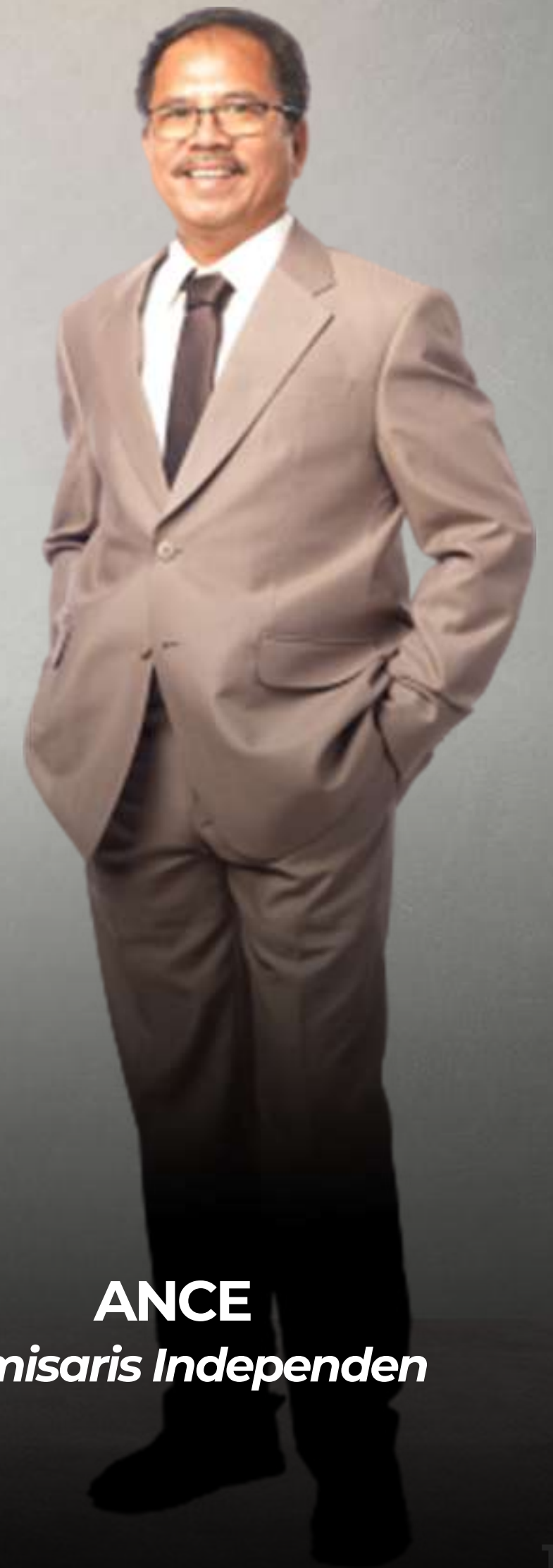
ANCE Komisaris Independen